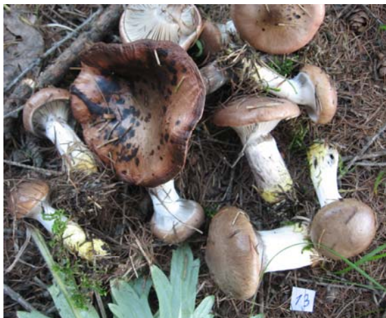
Рисунок 1 – Мокруха еловая

Мокруха еловая. Шляпка 5-12 см в диаметре, вначале полушаровидно-выпуклая с загнутым к ножке краем, потом слегка плоско-выпуклая, затем вдавленная с флагообразным краем, слизистая, светло серовато-буроватая, у зрелых плодовых тел красновато-буроватая по краю, светлой серединой и черными пятнами по всей поверхности шляпки. Край шляпки с остатками беловатого покрывала, которое на ножке остается не ясно выраженным колечком. Пластинки молодых плодовых тел беловатые, редкие (8-10 шт./см), толстые с редкими пластиночками у края шляпки; зрелые светло окрашенные буроватые, у перезрелых пурпурно-коричневые до почти черных. Ножка длиной 3,5-7 см, диаметром 0,7-2,8 см, цилиндрическая или слегка булавовидная к основанию или слегка суженая, к основанию со слизистым кольцом, сверху у молодых беловатая, гладкая, у зрелых при надавливании темнеет, низ ножки у всех экземпляров желтоватый местами с мелкими черными чешуйками. Мякоть мясистая, крепкая, белая или беловатая, в ножке желтоватая. Вкус нежный или слегка кисловатый, запах не различимый. (рис. 1).